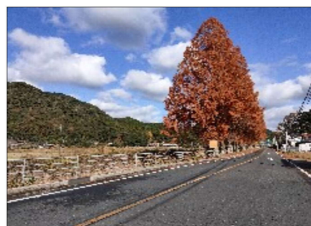
真長田地区のメタセコイア